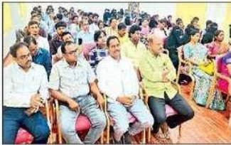
నదస్సుకు హాజరైన అధ్యాపకులు, విద్యార్థులు